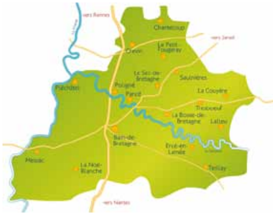
Emplacement des communes du territoire

Le parc d'activités de Château-Gaillard est un véritable bassin d'emplois puisque près de 800 personnes travaillent chaque jour dans la zone, ce qui lui vaut d'être le premier pôle d'emplois de la Communauté de Communes de Moyenne Vilaine et Semnon.