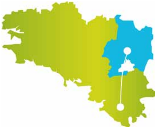
Emplacement de la Communauté de Communes de Moyenne Vilaine et Semnon