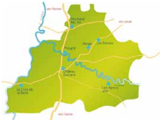
Emplacement des zones d'activités intercommunales